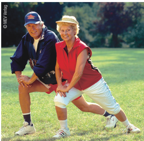
Tipp: Bewegung an der frischen Luft hilft bei Müdigkeit